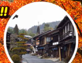
เมืองเก่าซึมาโกะ

บินสุดหรู: กับ 5 ดาว บริการแบบ FULL SERVICE!! น้ำหนักกระเป๋าสูงสุดถึง 46 กิโลกรัม