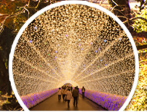
เทศกาลฤดูไฟ Nabana no Sato

ทัวร์ญี่ปุ่น นาโกย่า หุบเขาโคริงเค ชิราคาวาโกะ EASY AUTUMN